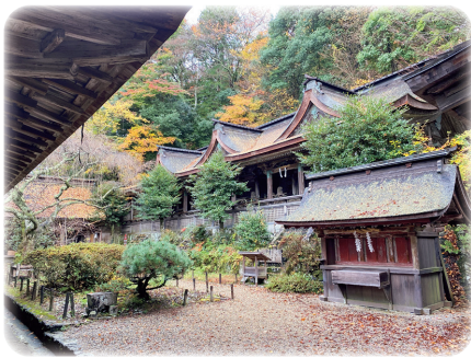
吉野水分(よしのみくまり)神社

初日最終は、「橿原神宮」を参拝させて頂き、過去は、三重の「伊勢神宮」より広大な敷地だったという、壮大な境内の広さと静粛な雰囲気神々のご利益を得たような不思議な気持ちを感じ取れました。